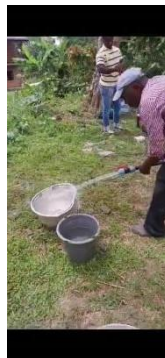
Essais de pompage