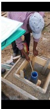
Préparation essais de pompage