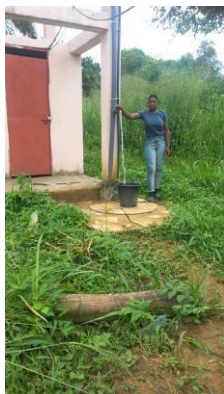
Robinet sur château d'eau