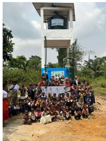
Inauguration de l'installation le 9 février 2024, en présence des écoliers et des autorités