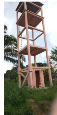
Le château d'eau